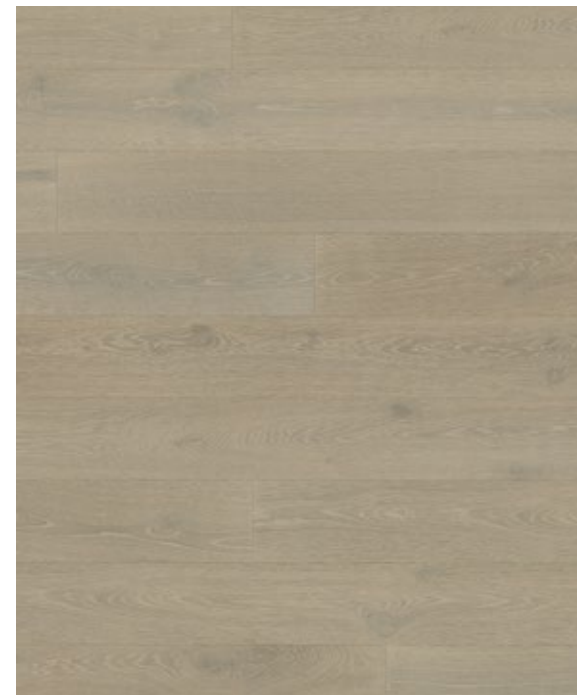
Atelier No.7 grey**

Fein abgestuft und harmonisch geeignet um zu kombinieren. Dezent Farbtöne lassen Holz und Raum natürlich erscheinen und bilden einen guten Boden für Möbel, Textilien und Accessoires.