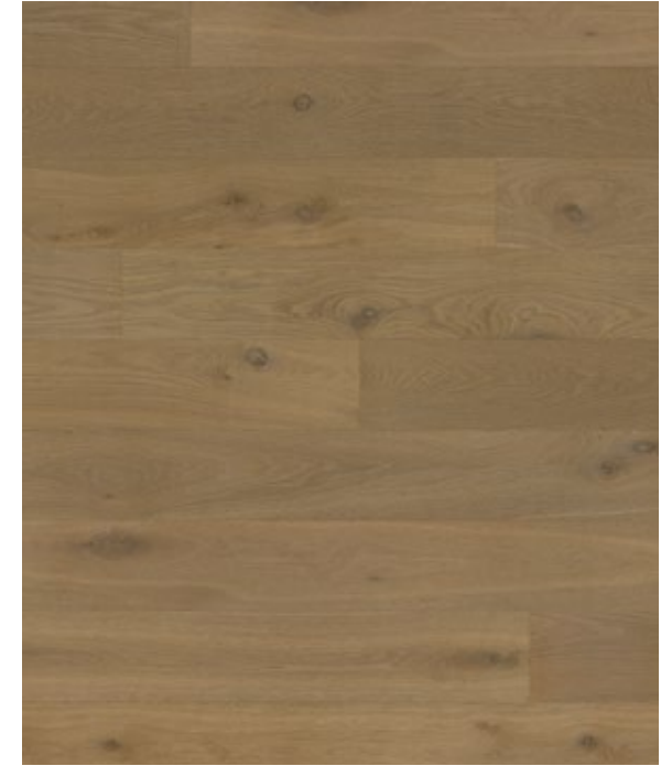
Atelier No.4 mood*