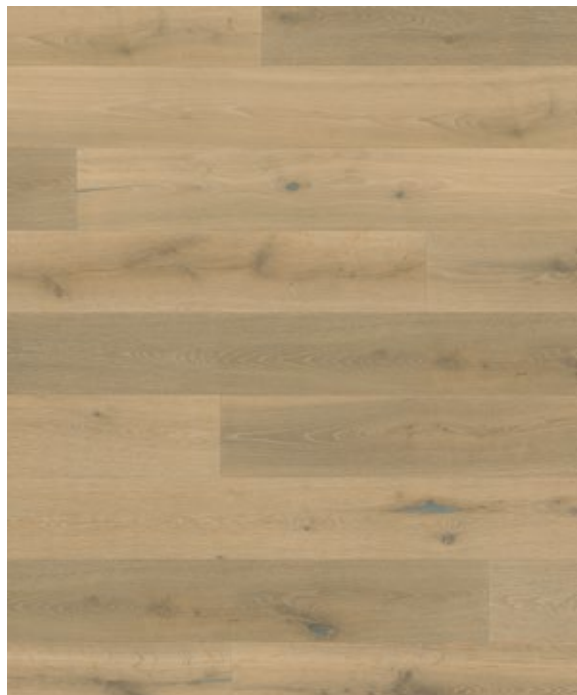
Atelier No.5 dune*