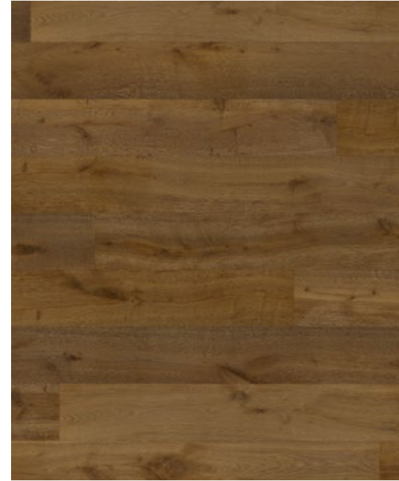
Atelier No.3 maron*