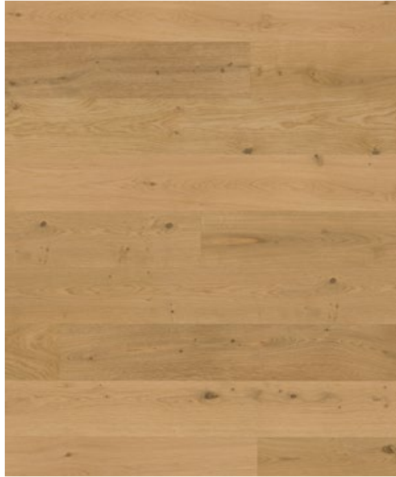
Atelier No.1 natur