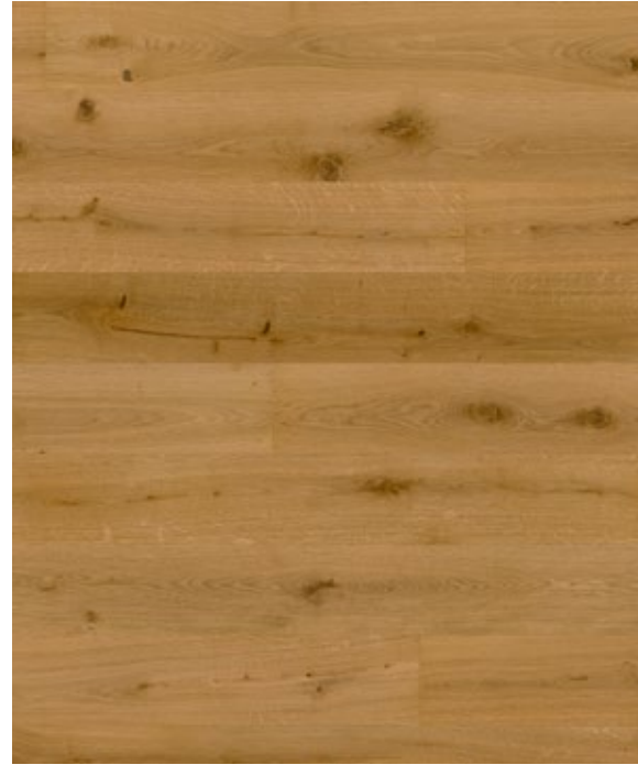
Atelier No.2 cognac