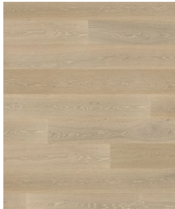
Atelier No.6 champagne