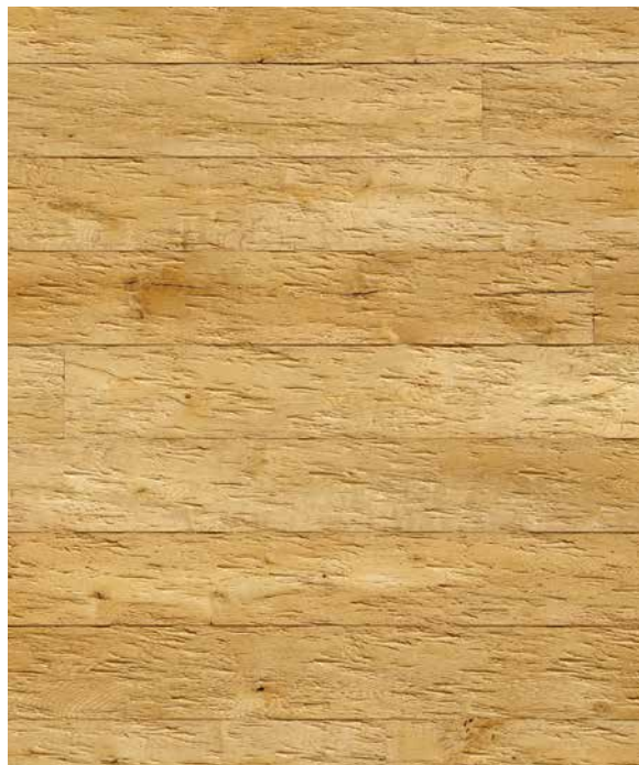
SAND gehackt (auch in gesägt erhältlich)