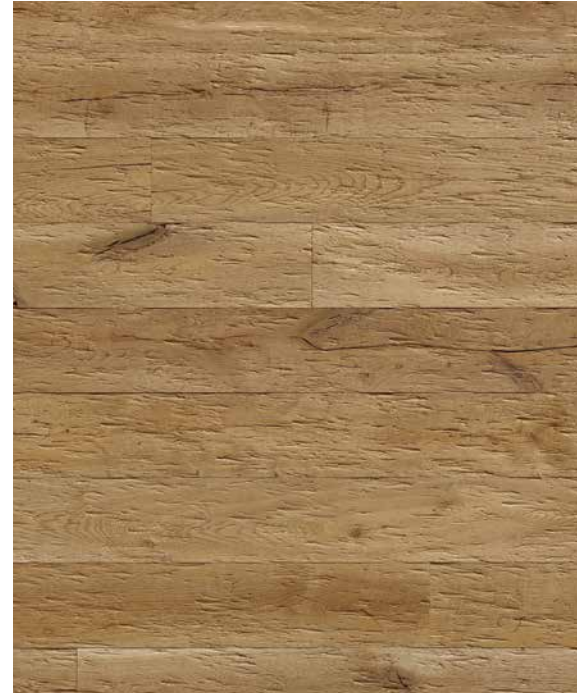
TABAC gehackt (auch in gesägt erhältlich)